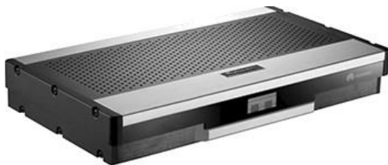
Produit existant Extrémité - Point de vue 8036