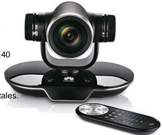
Nouveau produit Endpoint - TE40